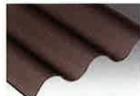
エンボスブロンズ